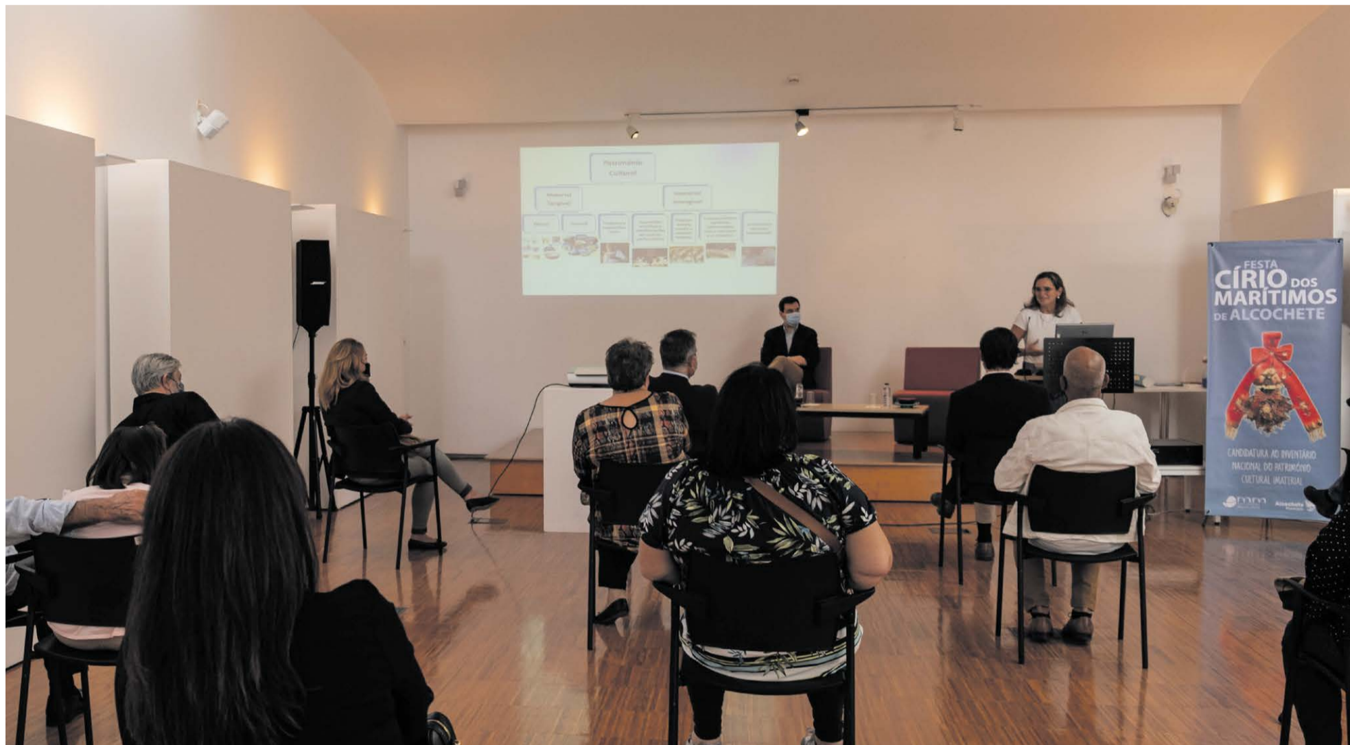
Biblioteca de Alcochete acolheu a apresentação da candidatura à inscrição da Festa do Círio dos Marítimos no Inventário Nacional de Património Cultural e Imaterial

A inscrição da Festa do Círio dos Marítimos no Inventário Nacional de Património Cultural e Imaterial é mais um passo para enaltecer a cultura e identidade locais manifestadas, neste caso, através de uma tradição com vários séculos.