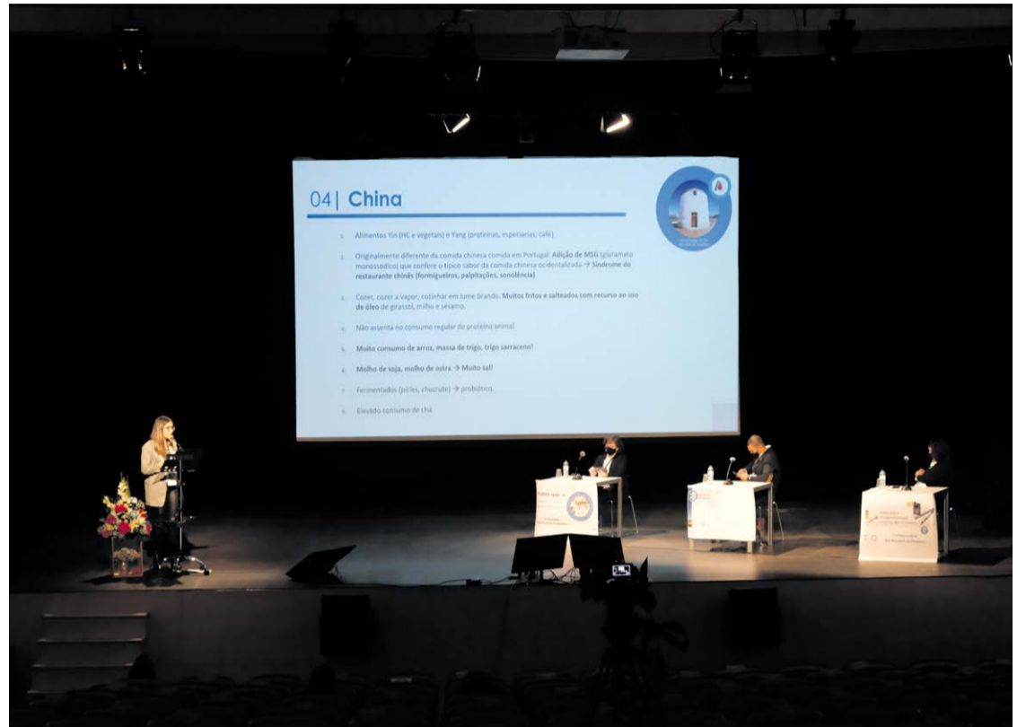
Alcochete recebeu debate sobre a diabetes, uma doença que afeta milhares de portugueses

A iniciativa dinamizada pela Academia da Diabetes, em parceria com o Centro Hospitalar Barreiro Montijo e o ACES Arco Ribeirinho, visou a sensibilização para a adoção de comportamentos saudáveis através da integração de diferentes profissionais de saúde, nomeadamente, de medicina interna, medicina geral e familiar, dermatologia, enfermagem, nutrição, gastroenterologia, entre outros que têm um objetivo em comum: a transmissão de informação atualizada, clara e abrangente. #