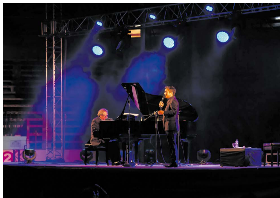
Camané e Mário Laginha encantaram com temas do álbum “Aqui está-se sossegado”

Este foi mais um evento seguro promovido pela câmara municipal que assegurou todas as condições para que os espectadores assistissem aos espetáculos em segurança. #